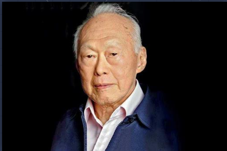
Lee Kuan Yew

„Svakog puta kada neko započne nešto što bi moglo negativno uticati na ovaj organizovan, racionalan i razuman poredak, pa ga time učiniti iracionalnim i emotivnim – zaustavljam ga bez oklijevanja.“